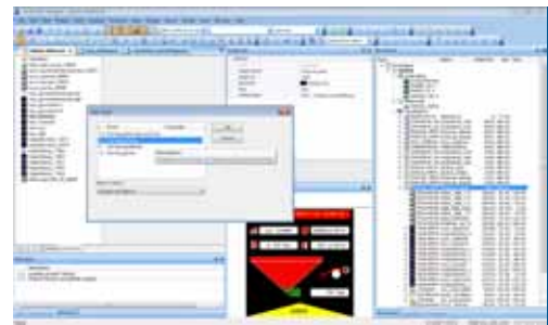
Für die Praxis optimiert

Profitieren Sie von zahlreichen Komfortfunktionen, die Ihnen das tägliche Arbeiten erleichtern. So lässt sich auch die Arbeitsoberfläche an Ihre individuellen Bedürfnisse anpassen. Alle Funktionen durchlaufen zunächst einen intensiven Praxistest, bevor sie final in das Programm implementiert werden.