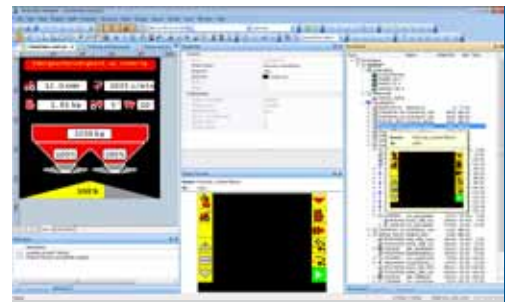
Alles im Blick

Zur optimalen Projektverwaltung werden die Objekte in einer Baumstruktur mit Vorschaufunktion abgelegt. Der ISO-Designer unterstützt alle spezifizierten Level der Norm. Beim Anlegen eines neuen Projektes können Sie frei wählen, welche Spezifikationen gelten sollen. Die automatische Farbkonvertierung importierter Bilder sichert stets die Einhaltung der ISO-Norm.