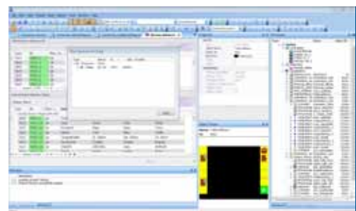
Sprachenverwaltung schnell und effizient

Mit dem ISO-Designer konfigurieren Sie mehrsprachige Masken besonders einfach. Eine Ressourcendatei speichert dabei alle notwendigen Informationen. Je nach aktiver Sprache werden die zugehörigen Texte angezeigt. Die Ressourcendatei lässt sich auch als Tabelle exportieren und wieder einlesen, was eine externe Übersetzung der Texte beträchtlich erleichtert.